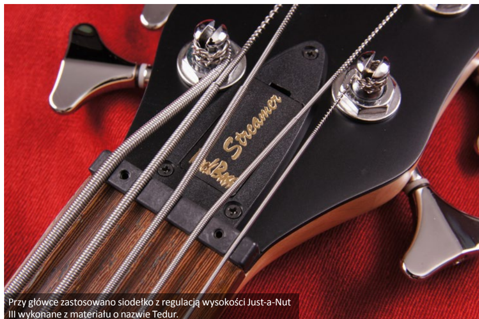
Przy główce zastosowano siodełko z regulacją wysokości Just-a-Nut III wykonane z materiału o nazwie Tedur.

Gitara jest stosunkowo lekka, ma niewielki korpus, dobrze dostosowany anatomicznie do tułowia grającego. Spłaszczony gryf zapewnia wysoki komfort gry, a jego opanowanie nie powinno stanowić problemu nawet dla osób z krótkimi palcami. Dostęp do wysokich pozycji jest dobry, jednak osiągnięcie dwóch ostatnich progów jest utrudnione – kształt wycięcia wydaje się być bardziej podporządkowany estetyce niż ergonomii. Poza tym drobnym mankamentem trudno mieć jakiegokolwiek inne zastrzeżenia do formy lub wykończenia instrumentu, który jak na swoją klasę cenową reprezentuje bardzo wysoki poziom jakości. Po dłuższym graniu nie odczuwa się praktycznie żadnego zmęczenia, co warunkuje wspomniana niewielka waga i wygodne kształty. Na przekór wyrazowi „vintage” w nazwie przetworników, testowany bas można zaliczyć do instrumentów typu modern. To nowoczesnie brzmiący instrument, który świetnie sprawdzi się przede wszystkim w klimatach rockowych i metalowych. Ma dość silny sygnał i dźwięk, który można określić jako lekko skonturowany – podstawa jest przyjemnie zaakcentowana, środek delikatnie wycofany, góra wyrównana i na szczęście nie przesadzona. Przetwornik przy gryfie daje dźwięk ciepły i jakby przydymiony, niski środek jest tu